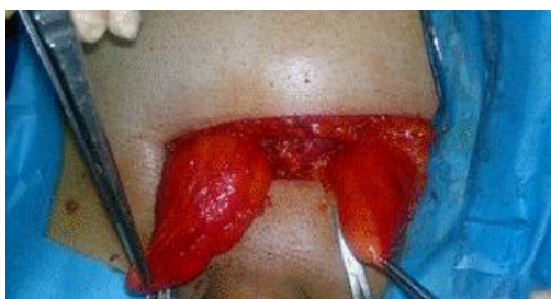
شکل ۲. ساک های فتق دوطرفه که در محل عمل نمایان شده است