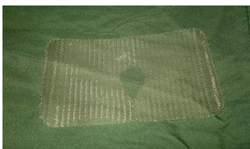
شکل ۳. مش پلی پروپیلن بکار رفته در عمل